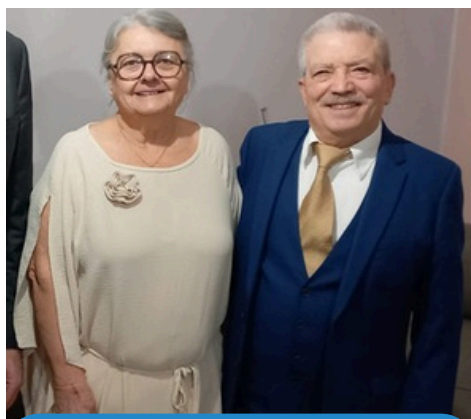
16 JANVIER 2026 50 ANS DE MARIAGE M. ET MME ALLONGE