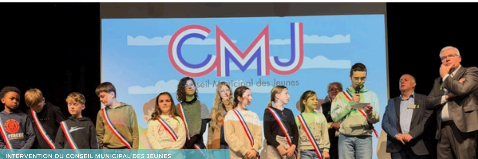
INTERVENTION DU CONSEIL MUNICIPAL DES JEUNES

La cérémonie a notamment été marquée par la remise de 4 écharpes. Chaque jeune s'est présenté simplement.