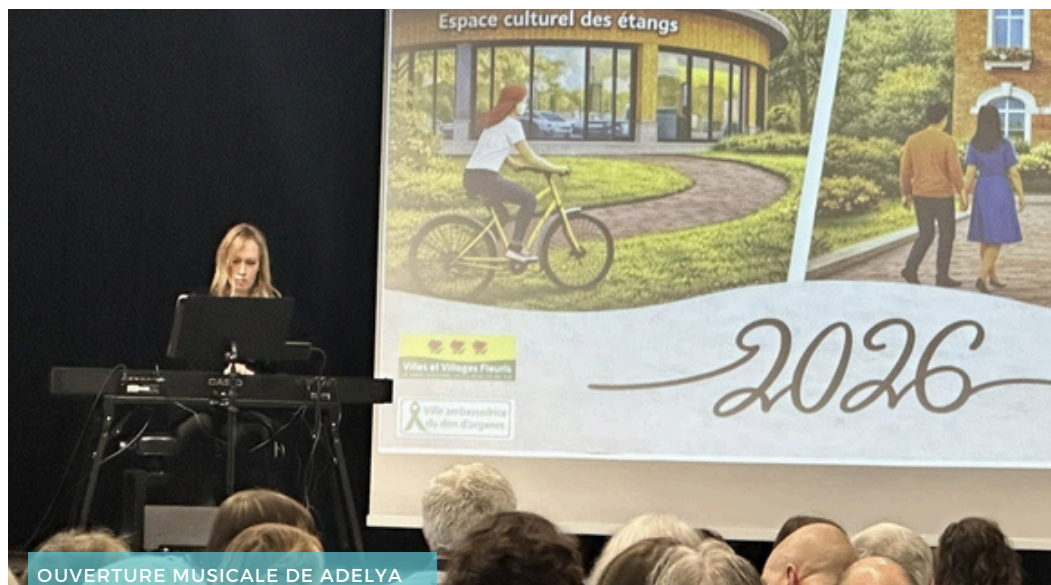
OUVERTURE MUSICALE DE ADELYA

Le 31 janvier dernier, Aubers a vécu l'un de ses rendez-vous les plus importants de l'année : la traditionnelle cérémonie des Vœux aux Aubersois. Un moment simple et chaleureux, où l'on prend le temps de se retrouver entre habitants, élus, associations et partenaires de la commune