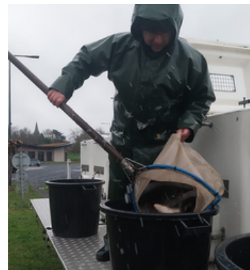
27 JANVIER 2026 Rempoissonnement des étangs