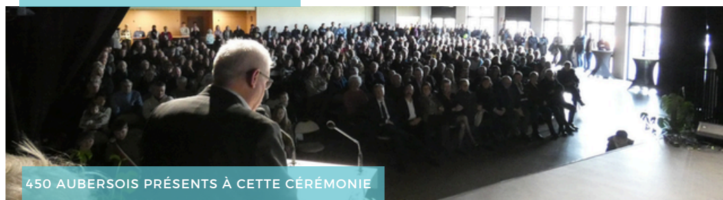
450 AUBERSOIS PRÉSENTS À CETTE CÉRÉMONIE