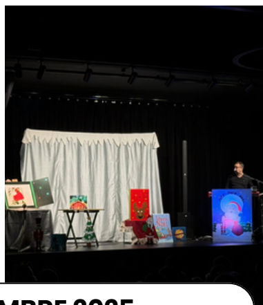
18 DÉCEMBRE 2025 Spectacle de NOËL offert aux enfants des écoles Auberssoises